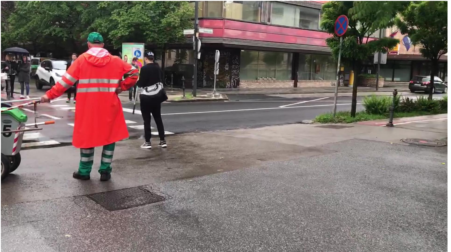
Slike (splošne ali specifične, lokacija, če je znana):