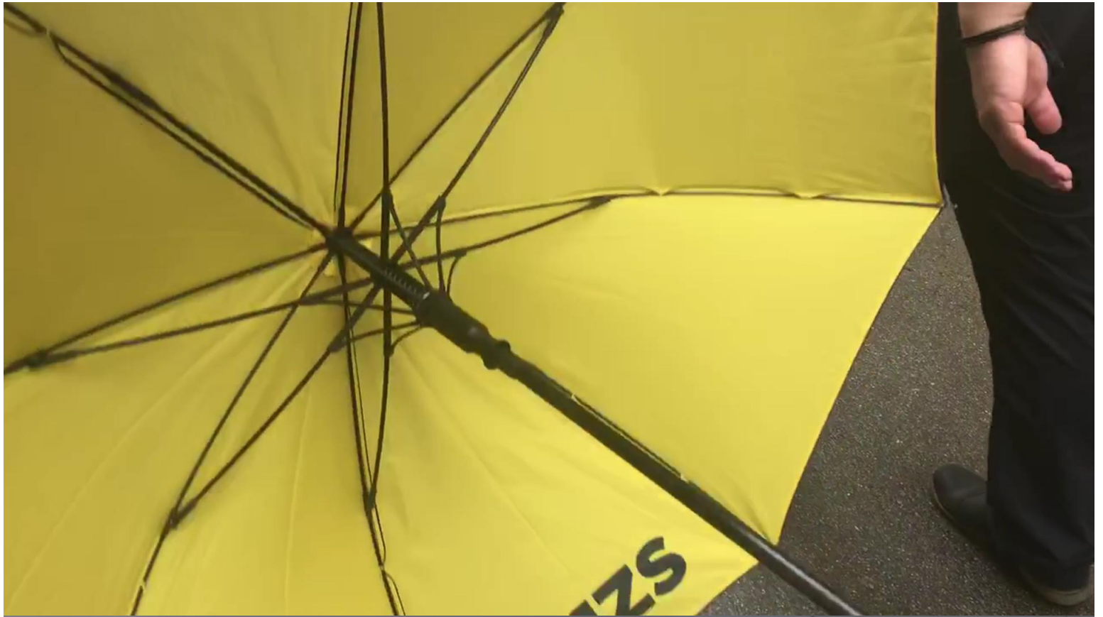
Slike (splošne ali specifične, lokacija, če je znana): Prešernov trg.